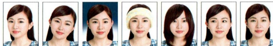
頭部側向一邊、未正視鏡頭 頭部傾斜不正 背景色彩非白色 臉部及雙耳被物品遮蔽 頭髮遮蔽到眼睛或耳朵 眼睛未正視鏡頭 使用有色隱形眼鏡