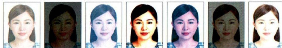
太亮 太暗 對比不足褪色 對比太強 皮膚色調不自然 曝光不足 曝光過度