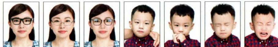
配戴粗框眼鏡 鏡框遮蔽到眼睛 鏡片反光 非獨照、出現其他人、物影像 嘴巴被手遮蔽 閉眼睛 表情不自然、哭泣