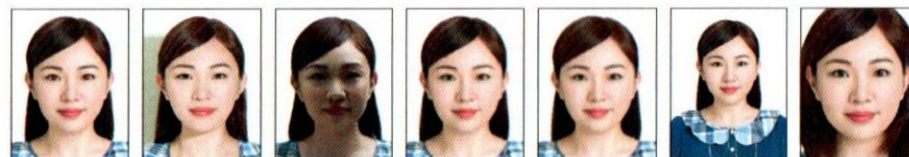
紅眼 背景有陰影 臉部陰影 解析度過低 模糊、對焦不正確 頭部比例過小 頭部過大、頭髮碰觸邊框